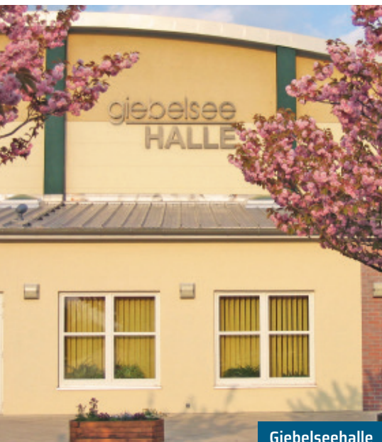
Giebelseehalle K. Brandau