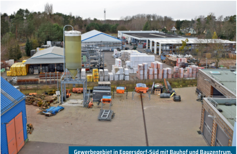
Gewerbegebiet in Eggersdorf-Süd mit Bauhof und Bauzentrum.

In Umsetzung ihres Auftrages nach der EG-Dienstleistungsrichtlinie bietet die Gemeinde Petershagen/Eggersdorf ein Verwaltungsverfahren zur elektronischen Gewerbemeldung an.