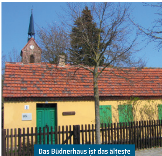
Das Büdnerhaus ist das älteste Haus der Gemeinde.

Machen Sie einen Abstecher zur Giebelseehalle neben der Schule. Sportliche und kulturelle Höhepunkte erwarten Sie hier. Oder gehen Sie durch die Triftstraße zum Teilungssee und genießen Sie den Blick über die spiegelnde Wasseroberfläche. Oder wandern oder radeln Sie an den Stienitzsee. In dem schönen, märchenhaften Wald ist man weit weg von Lärm und Stress, nur die Baumwipfel rauschen leise. Angler und Wassersportvereine haben hier ihre Heime und Liegeplätze. Entdecken Sie Petershagen! Eins werden Sie überall finden: Eine herrliche Natur.