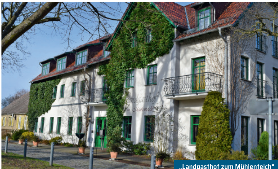
„Landgasthof zum Mühlenteich“

Altlandsberger Chaussee 19, OT Eggersdorf 5 Zimmer Tel. 03341 48113