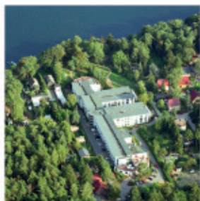
Seniorenresidenz Am Straussee im Strausberger Ortsteil Jenseits des Sees