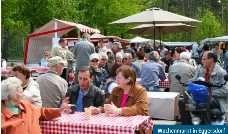
Wochenmarkt in Eggersdorf