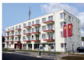
In Strausberg Wriezener Straße sind Seniorenwohnungen mit Smart Home-Technik im Angebot.

Hier sind Pflege und Service-Wohnen unter einem Dach. Sie können neben der Stationären Pflege auch seniorengerechte Wohnungen inklusive Serviceleistungen in Anspruch nehmen, die den Alltag erleichtern.