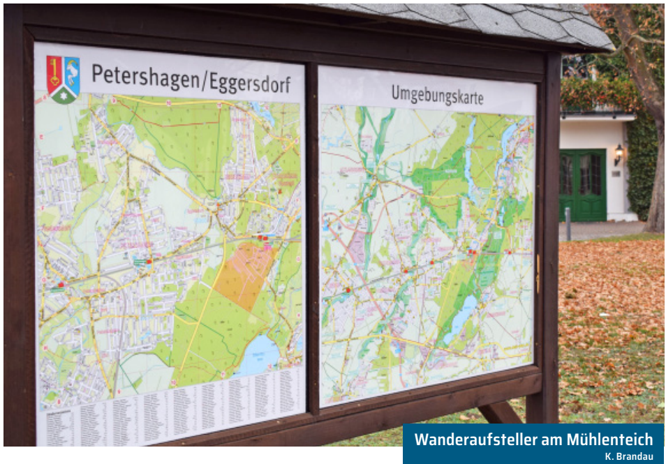
Wanderaufsteller am Mühlenteich K. Brandau

An der Tasdorfer Straße biegen wir links ab und überqueren die Bahnlinie in Richtung Friedhof. Nehmen wir uns doch die Zeit für einen Gang über den Friedhof! Ein gepflegter, naturumgebener Ort der Stille unter der Obhut der ev. Kirchengemeinde. Auf den Tafeln der Erbbegräbnisse lesen wir die Namen alteingesessener Eggersdorfer