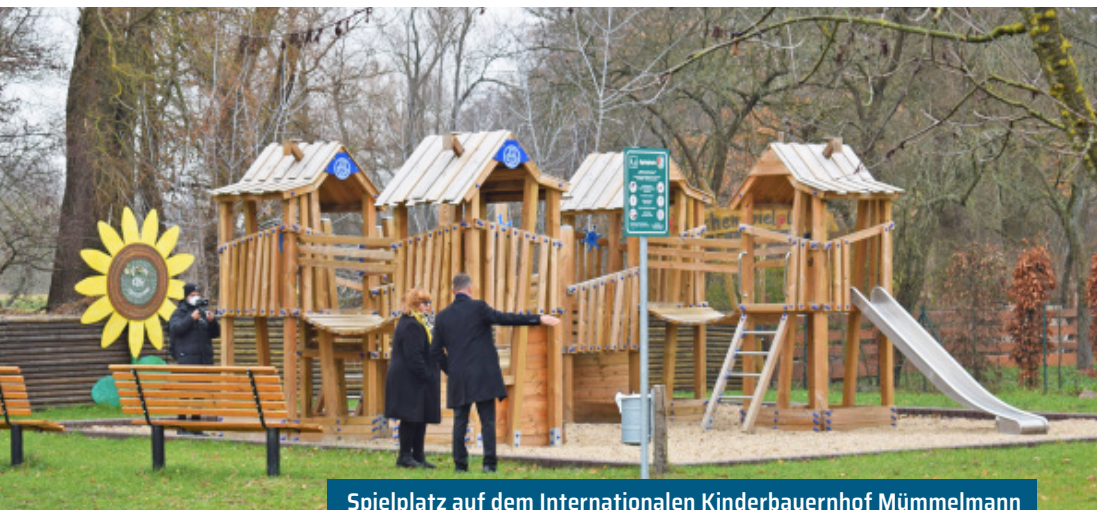
Spielplatz auf dem Internationalen Kinderbauernhof Mümmelmann K. Brandau