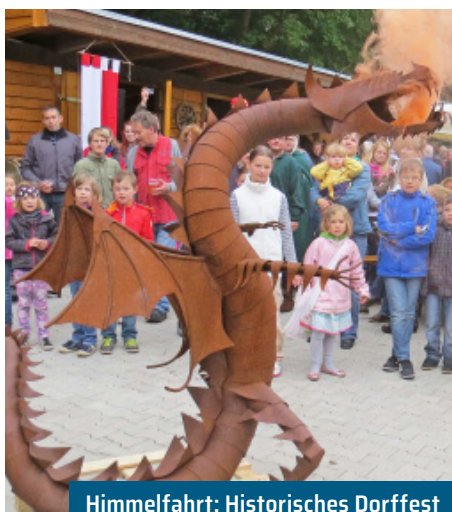
Himmelfahrt: Historisches Dorffest Bauernvolk Eggersdorf e. V.