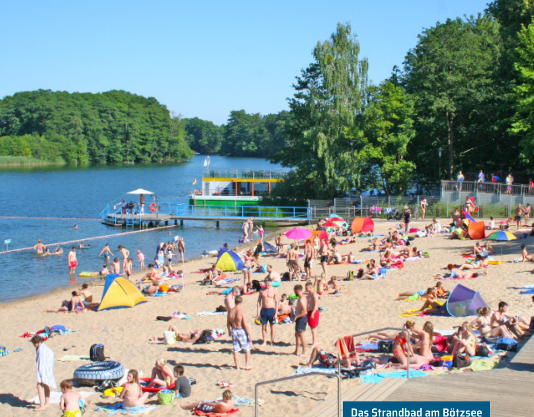
Das Strandbad am Bötzeesee K. Brandau