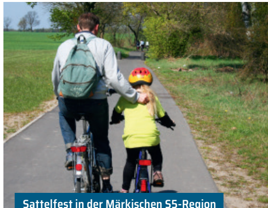
Sattelfest in der Märkischen S5-Region K. Brandau