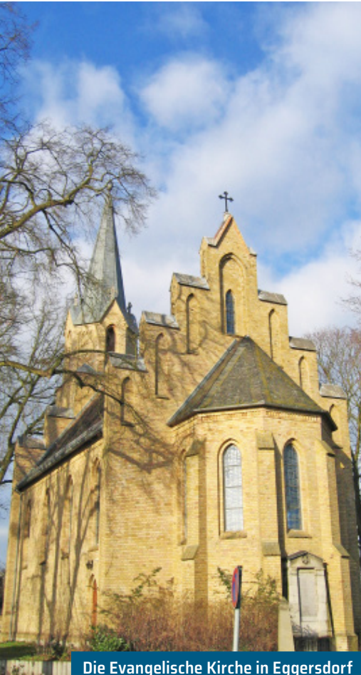
Die Evangelische Kirche in Eggersdorf