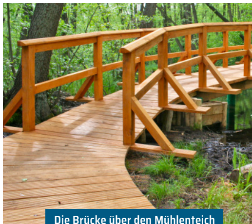
Die Brücke über den Mühlenteich K. Brandau

Noch mehr Wandertipps gibt's in der Rad- und Wanderwegekarte des Doppeldorfes (für 1 € im Rathaus Eggersdorf) sowie in der Karte „S5-Region“, die in den Touristinformationen Strausberg, Hoppegarten, Rüdersdorf und Altlandsberg erhältlich ist.