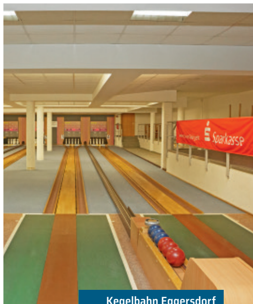
Kegelbahn Eggersdorf