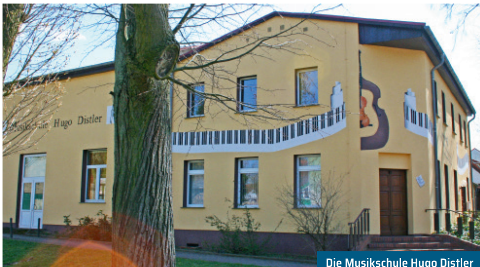
Die Musikschule Hugo Distler K. Brandau

Vier Häuser laden im Doppeldorf mit einem großen kulturellen Angebot ein: