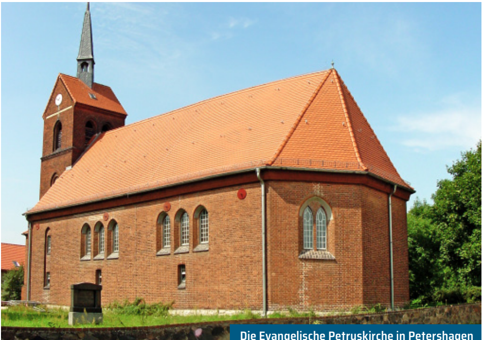
Die Evangelische Petruskirche in Petershagen